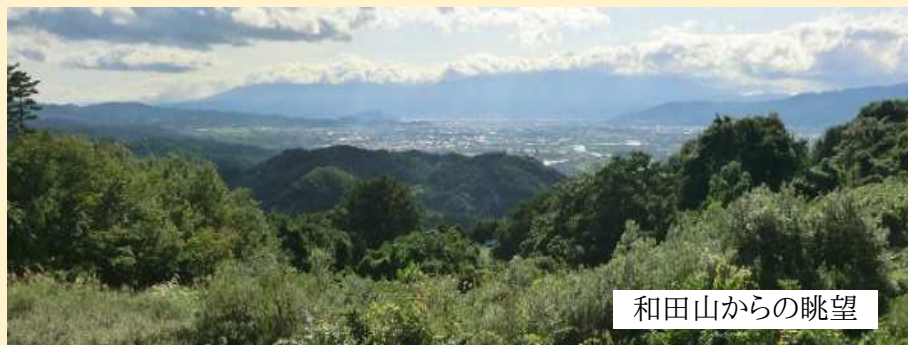
和田山からの眺望