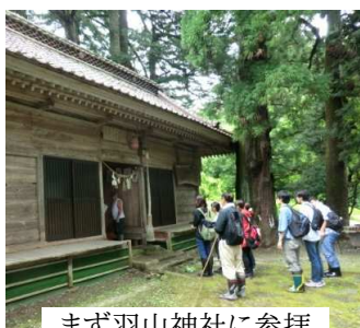
まず羽山神社に参拝