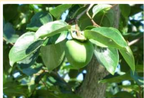
インゲン畑、名産の柿