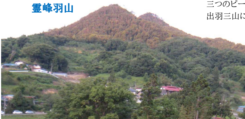
三つのピークを出羽三山に見立て