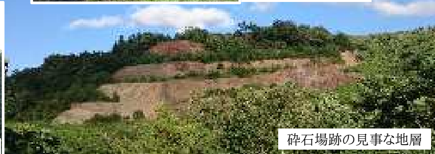
碎石場跡の見事な地層