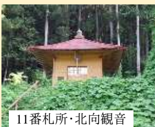
11番札所・北向観音